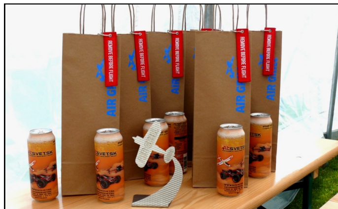
Každý pilot dostal od usporiadateľa niečo na pamiatku

Toto leto sa vyznačovalo ustáleným, suchým a horúcim počasím, čo naznačovalo, že i 13. ročník modelárskeho leteckého dňa „Air Grill“, naplánovaný na 13. 7. 2024 by mohol prebehnúť bez klimatických problémov. Čas plynul, prípravy vrcholili, doladňovali sa posledné zmeny až prišiel spomínaný dátum.