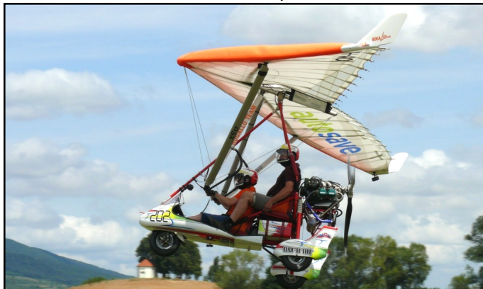
Súčasťou programu bolo aj vystúpenie a vyhladkové lety Rogallo Teamu z Dubovej