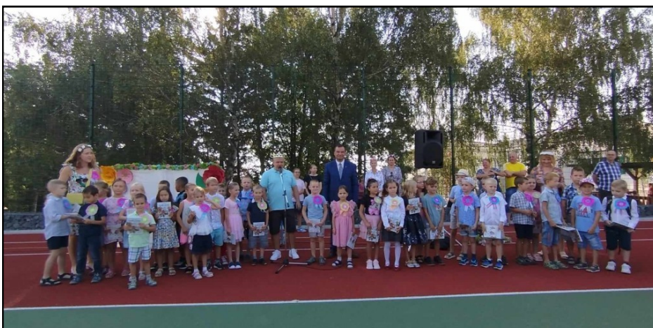
Spoločná fotografia 1. ročník

Nadišiel ten veľký deň, spoločne s rodičmi postávali ráno pred školou, s kvetinkami a darčekmi pre pani učiteľky a pozorne sledovali, ktorá bude tá ich - naša... A skoro a rýchlo sa to aj dozvedeli.