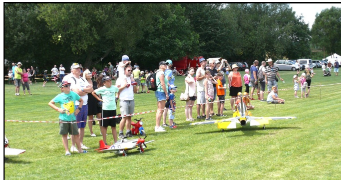
Napriek horúcemu počasiu prišlo na Air Grill niečo cez 500 malých i veľkých návštevníkov

Sobota, deň konania Air Grill privítala všetkých pilotov i návštevníkov krásnym slnečným, ale ako sa už stáva pravidlom, trochu veterným počasím. Prví piloti dorazili na letisko v priebehu štvrtka a piatka. Mali tak možnosť otestovať svoju techniku, či je všetko tak, ako má byť, prípadne niečo zmeniť a doladiť, aby v sobotnom programe leteckého dňa dopadlo všetko na 100% a mali radosť z vystúpenia oni aj diváci.