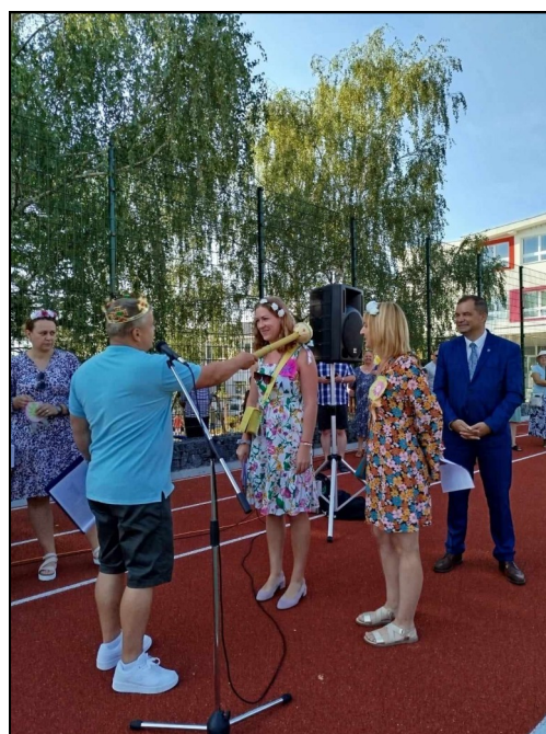
Pasovanie triednych učiteľiek

Pre mnohých z nich to bol nezabudnuteľný okamih, ktorý si budú pamätať po celý život. Želáme všetkým žiačkam aj žiakom, učiteľskému zboru aj rodičom detí úspešný a inšpiratívny školský rok.