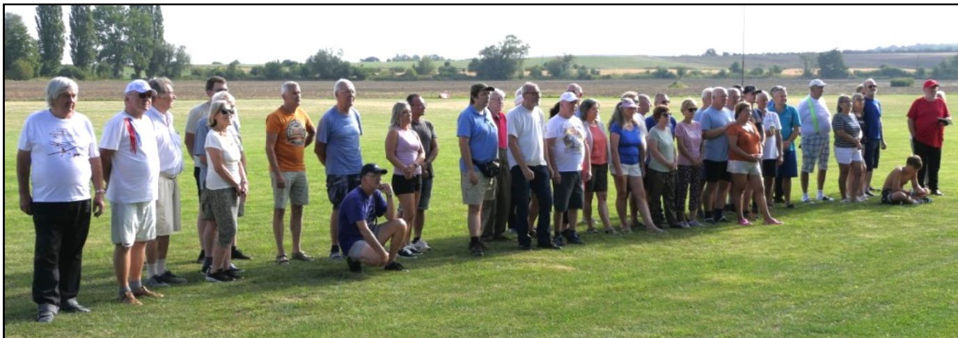
Spoločný nástup pretekárov pri otvorení súťaže