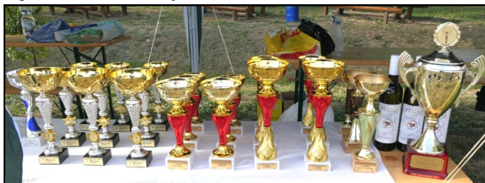
Trofeje pre víťazov