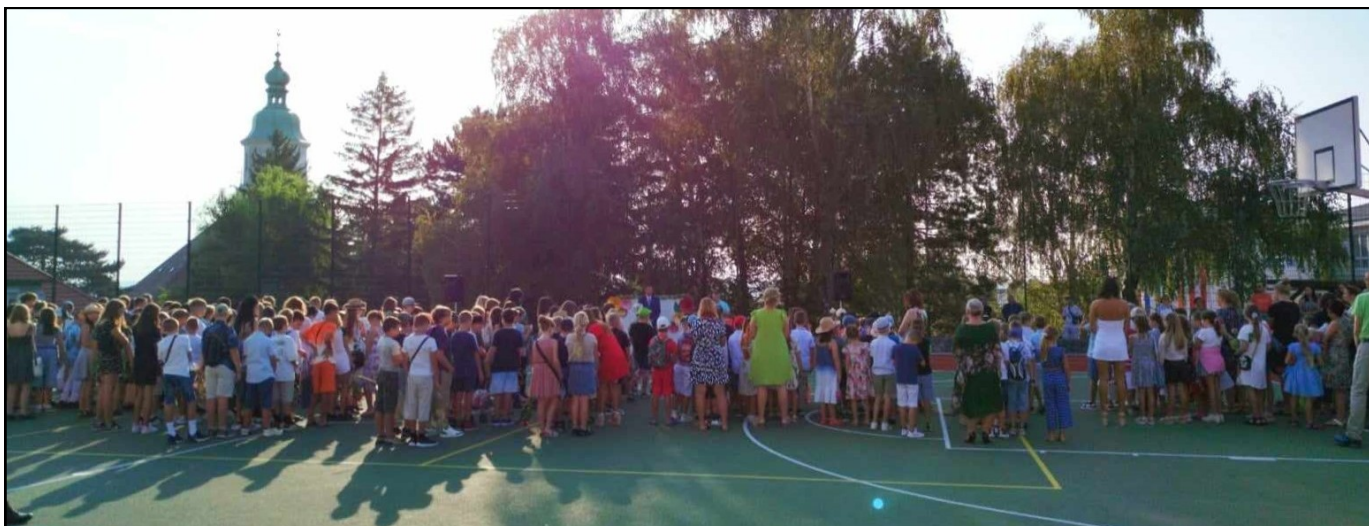
Prvý školský deň - všetci