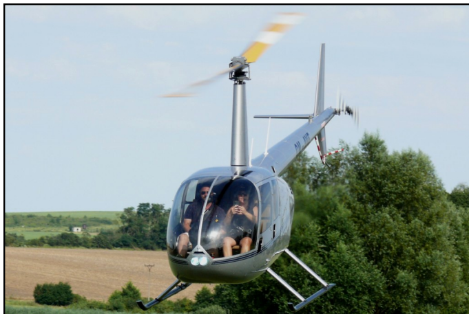
Návštevníci Air Grill mali k dispozícii po celý deň vyhliadkové lety

občerstvenie v hlavnom, registračnom a riadiacom stane – kávu, čapované pivo, kofolu a na zahryznutie domácu štrúdlu. Ako vždy sa k prvému obedu podával chutný guláš a neskôr popoludní ako druhý obed pečené kurča. Pre divákov bol k dispozícii v zázemí letiska, v tieni stromov bufet, ktorý bol taktiež intenzívne navštevovaný. Niet divu, veď teploty